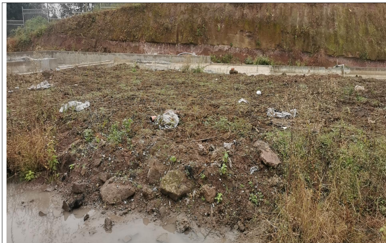
厂区绿化覆土情况