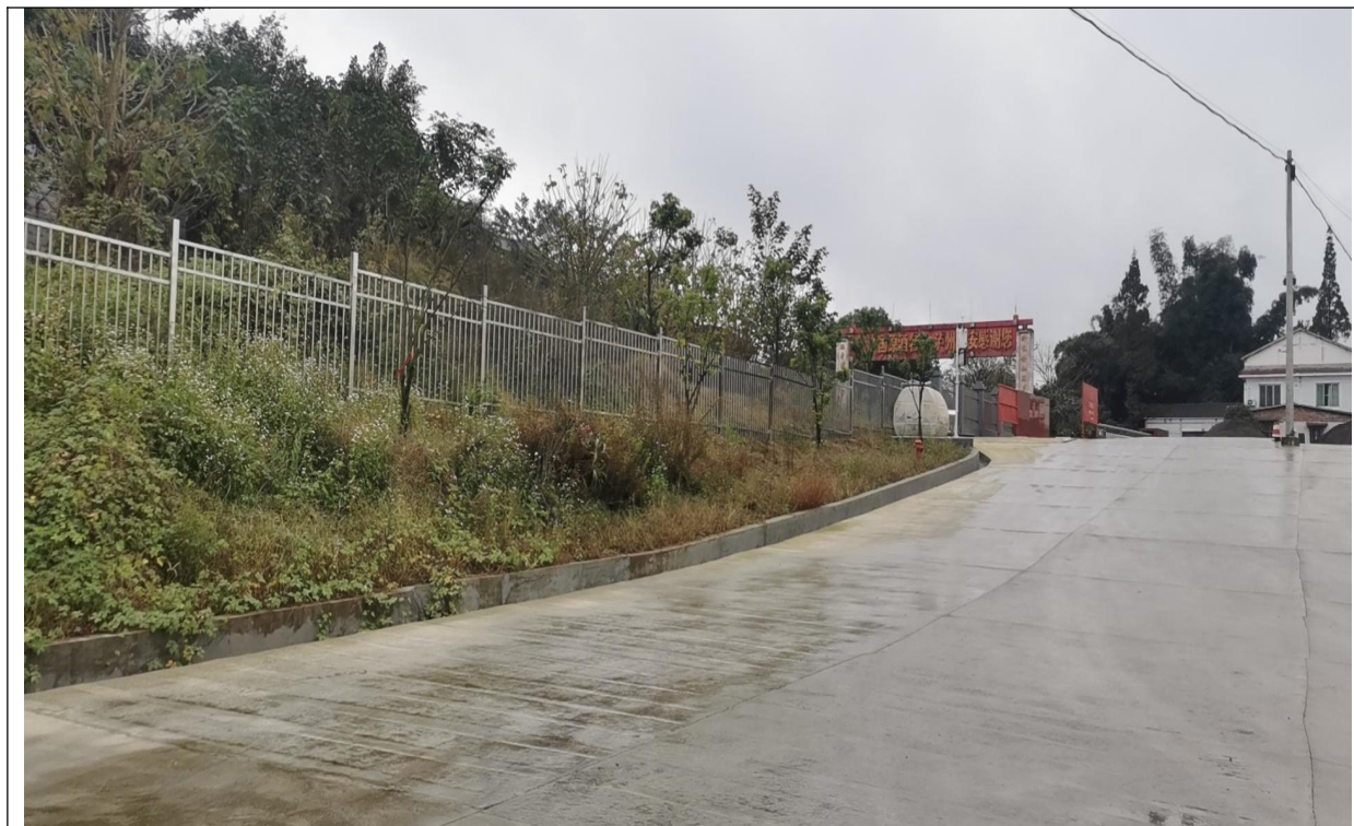
厂区入口处绿化、雨水排水沟及厂区地面硬化