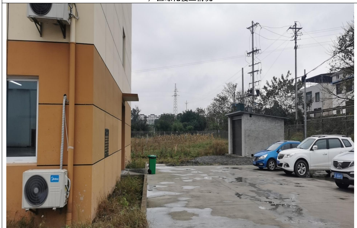
建筑四周绿化及地面硬化措施